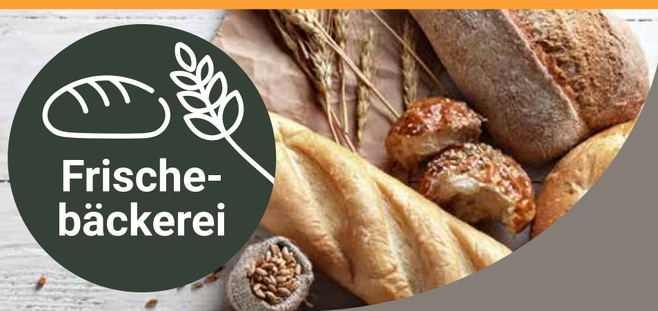
Kartoffelbrot 1 kg = 2.67